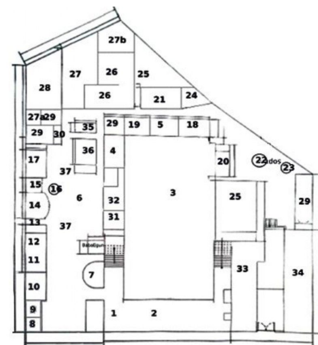
Figura 4 – Planta baixa do terreiro e no Quadro 1 os locais internos no terreiro com o seu sagrado. Fonte: Figura 4 – Livro: Terreiros tombados em São Paulo – autor: Wagner Gonçalves Silva. Fonte: Quadro 4 - Dados compilados pela autora.

Sobre o seu caminho em terras paulistas, Queiroz (2023) no seu trabalho: Orixás e a sua complexidade sistêmica com Design, Arquitetura e Urbanismo e Arte no terreiro Axé Ilê Obá em São Paulo, faz um resumo das décadas de luta deste povo negro, que o terreiro teve início de suas atividades na década de 1950, no centro da capital paulista, com o Babalorixá Caio de Xangô, na Congregação Espírita Beneficente Pai Jerônimo. Em 1960 a casa reabriu no bairro do Jabaquara, na Rua Mucuri, devido a necessidade de