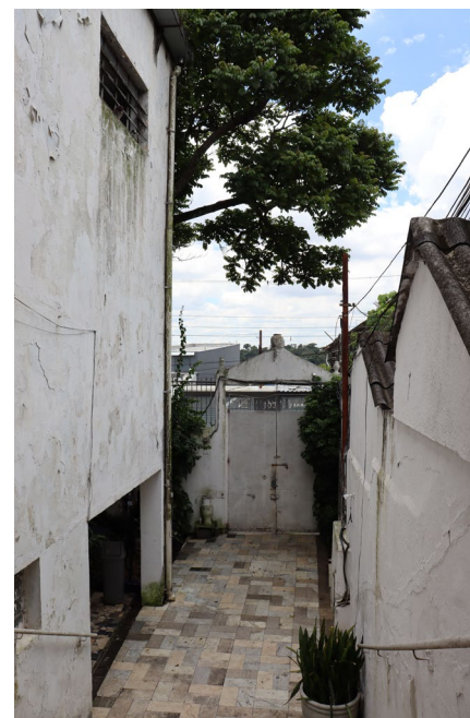
Foto frontal do terreiro Axé Ilê Obá (esquerda), ao lado, Figura 3 - Foto em perspectiva da sua escadaria para o portão central com destaque para a parede lateral do salão principal (a esquerda na foto), projeto construído em um terreno em alcive.

munizou a população negra que organizou os canteiros de obra e executou. As populações negras pensaram e executaram grande parte do foi construído nas cidades do estado de São Paulo ao longo da nossa história.