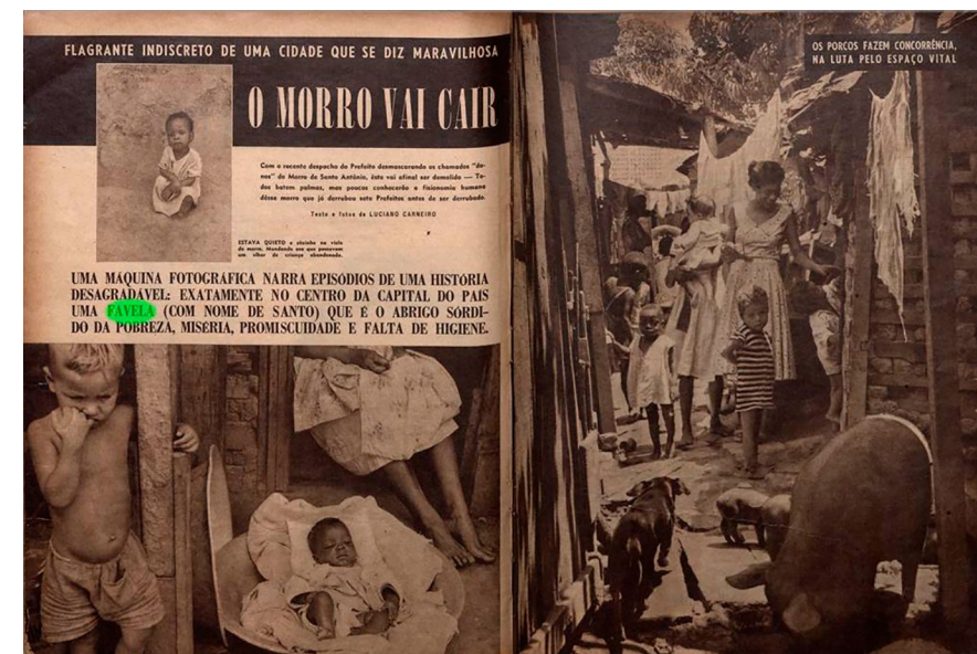
FIG. 3: Páginas da matéria “O Morro Vai Cair”. Fonte: CARNEIRO, L. O Morro Vai Cair. O Cruzeiro, v.27, n.37, 28 jun. 1954.

com matérias de denúncias da pobreza na capital paulista, incluindo da sujeira urbana geral à criminalidade. Em 1959, porém, duas matérias sobre São Paulo foram responsáveis por introduzir aspectos novos no debate: o papel do planejamento urbano e a voz do sujeito favelado.