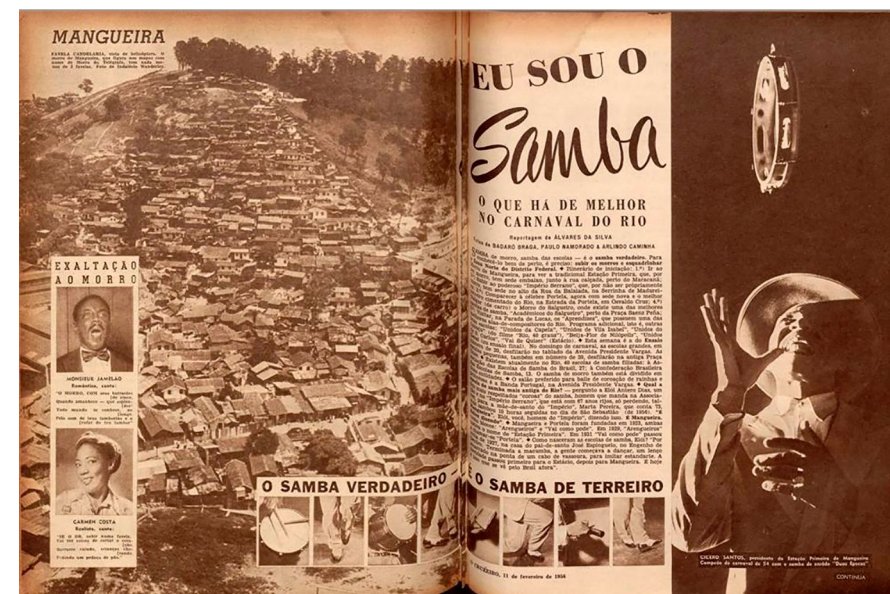
FIG. 2: Páginas da matéria "Eu Sou o Samba".

O aumento da presença do tema "favela" se deve em grande parte, também, à popularização massiva da cultura do samba que "desce os morros" e invade a vida boêmia do Rio de Janeiro para depois se alastrar por todo o país. Os blocos e, principalmente, as escolas de samba extrapolam seus antigos limites e se tornam parte da vida urbana geral em uma determinada parte do ano – como visto nas diversas páginas dedicadas ao assunto nas publicações feitas em época de Carnaval. O anúncio dos desfiles – com lista das escolas envolvidas e descrições de seus locais (geralmente morros) de origem