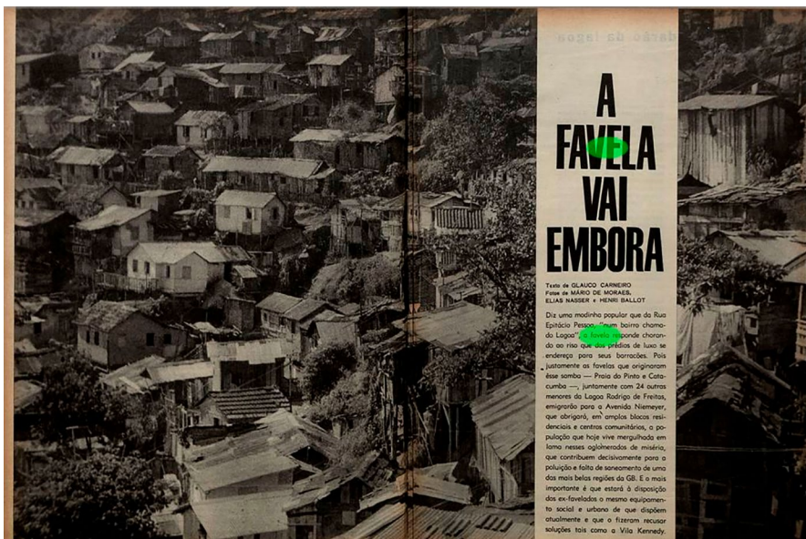
FIG. 5: Páginas da matéria "A Favela Vai Embora".

privilegiado devido ao sucesso de vendas da revista, a participação de grandes nomes do jornalismo brasileiro e também o crescimento vertiginoso da população urbana no país. Aferiu-se que, de fato, a favela passa a figurar fortemente no imaginário urbano, principalmente do Rio de Janeiro, mas posteriormente de São Paulo e de outras grandes cidades brasileiras. O fato de a mídia de massa ter muitos de seus atores principais situados no Rio de Janeiro nessa época, fortalece a divulgação da realidade da cidade por todo o país e, se a cidade é considerada o berço das favelas por assim dizer, o discurso propagado pelos veículos acaba chegando em muitos cantos da nação. Como demonstrado, o conteúdo publicado apresenta diversas facetas: por vezes pessimistas ao relatar a miséria e a criminalidade, em outras otimista ao proclamar glória à cultura popular do samba, ou mesmo rebatendo críticas internacionais mostrando que até mesmo "países de primeiro mundo" apresentavam formas de vida análogas às favelas. Esta diversidade de autores, sujeitos, interlocutores e temas atesta a frequência do assunto "favelas" nos meios de comunicação e, por conseguinte, seu impacto na cultura da época.